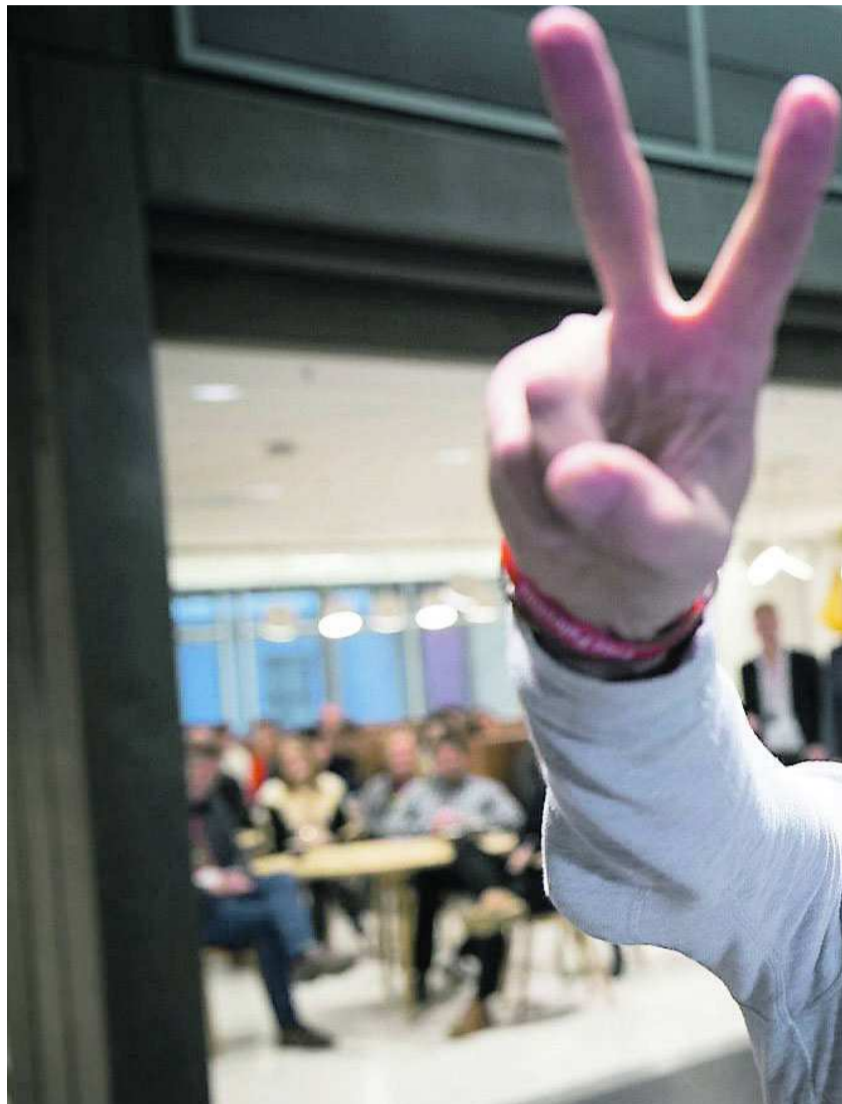
KONTROVERSIELL: Mads Gilbert ble av VGs lesere kåret til Årets navn i fjor. Det har falt kronikkforfatterne tungt for brystet.

video laget av den amerikanske nynazisten David Duke. The Lancets redaktør, Richard Horton, erklærte for sent at han var «forferdet over å oppdage at to av brevets medforfattere hadde videreføret et forrykt og støtende video. Det overlagte antisemittiske verdenssynet uttrykt i den videoen er avskyelig og fortjener universell fordømmelse».